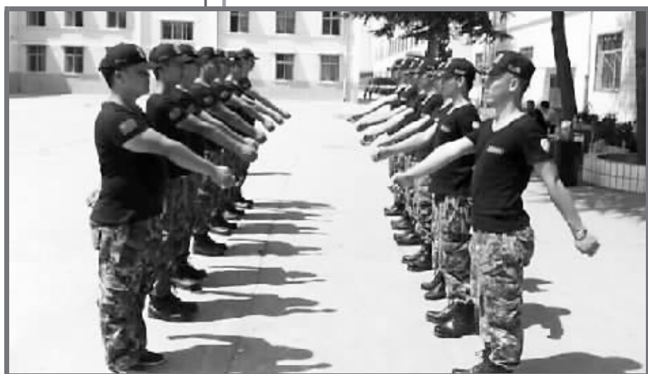
小武哥创建的“红色尖兵”退伍老兵军训拓展大队。